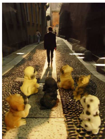
次回のミニ撮影会のイメージ 写真です。バックの写真の前に 犬の人形を置いて撮りました。