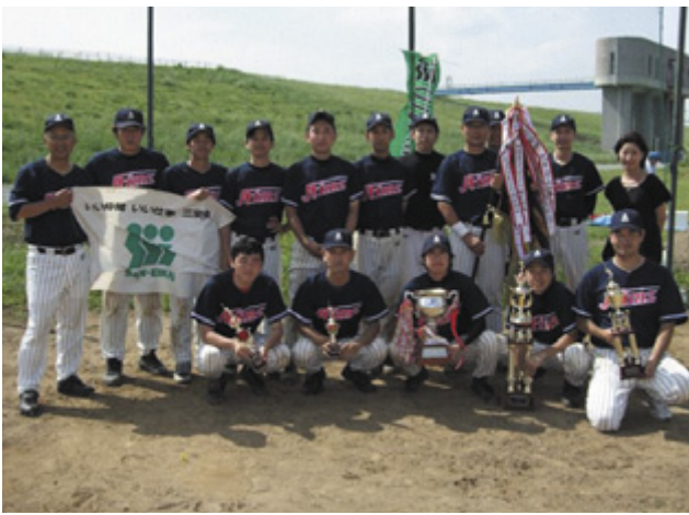
優勝したエームサービスの皆さん