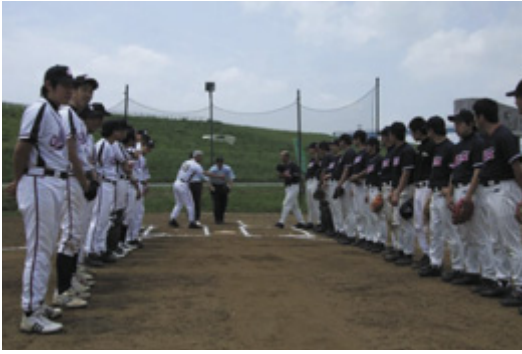
いざ決勝のプレーボール!