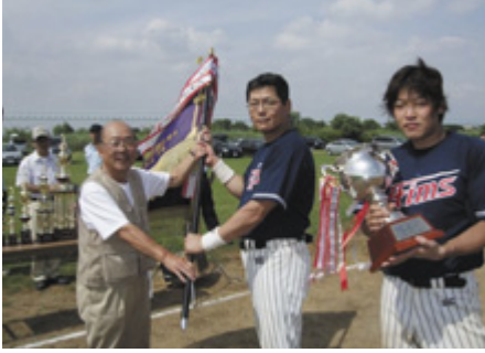
エームサービスに優勝旗、優勝杯を授与