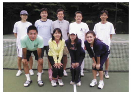
優勝した物産不動産のメンバー

二〇〇九年度第二回三栄会テニ ス大会が六月七日に予選大会、六月 二八日に決勝大会が行われました。 今年は昨年よりも三チーム多くご参 加頂き、合計一八チームの企業様にご 参加頂きました。 ここ数年天候にも恵まれず順延の 繰り返しでしたが今年にはほぼ予定通 りに進み、決勝大会では終了と同時に 雨が強くりましたが、けが人も なく無事終了しました。 昨年のデイブフェンディングチャン ピオンのティーガイアが文句なしの 内容で順当に決勝まで進み上がり、 もう一方では物産不動産がベストメ ンバーを揃えて勝ち上がってしまし た。接戦の末、物産不動産が二十一 で勝利、見事六年ぶり八度目、さら