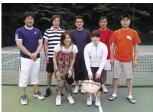
準優勝のティーガイアのメンバー