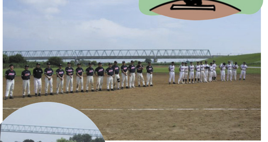
閉会式で整列の両ナイン。延長戦お疲れ様でした