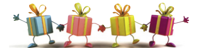
会場のあちこちで歓声が

また、今回の皆さんへの三栄会からの記念品はラブラドルの子犬の写真の入ったクリアファイルでした。Supported by SAN-EI-KAI印刷しました。大切に使うて頂き、これからも皆様のご支援をよろしくお願いたします。また、来年のサマーフェスタでお会いしましょう!