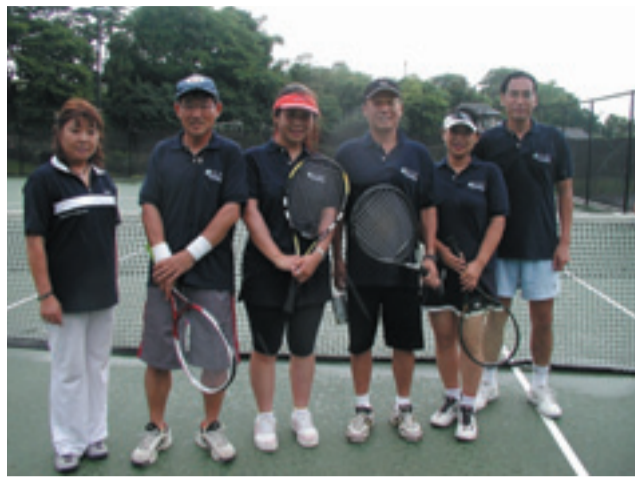
優勝した宇徳運輸Bチーム